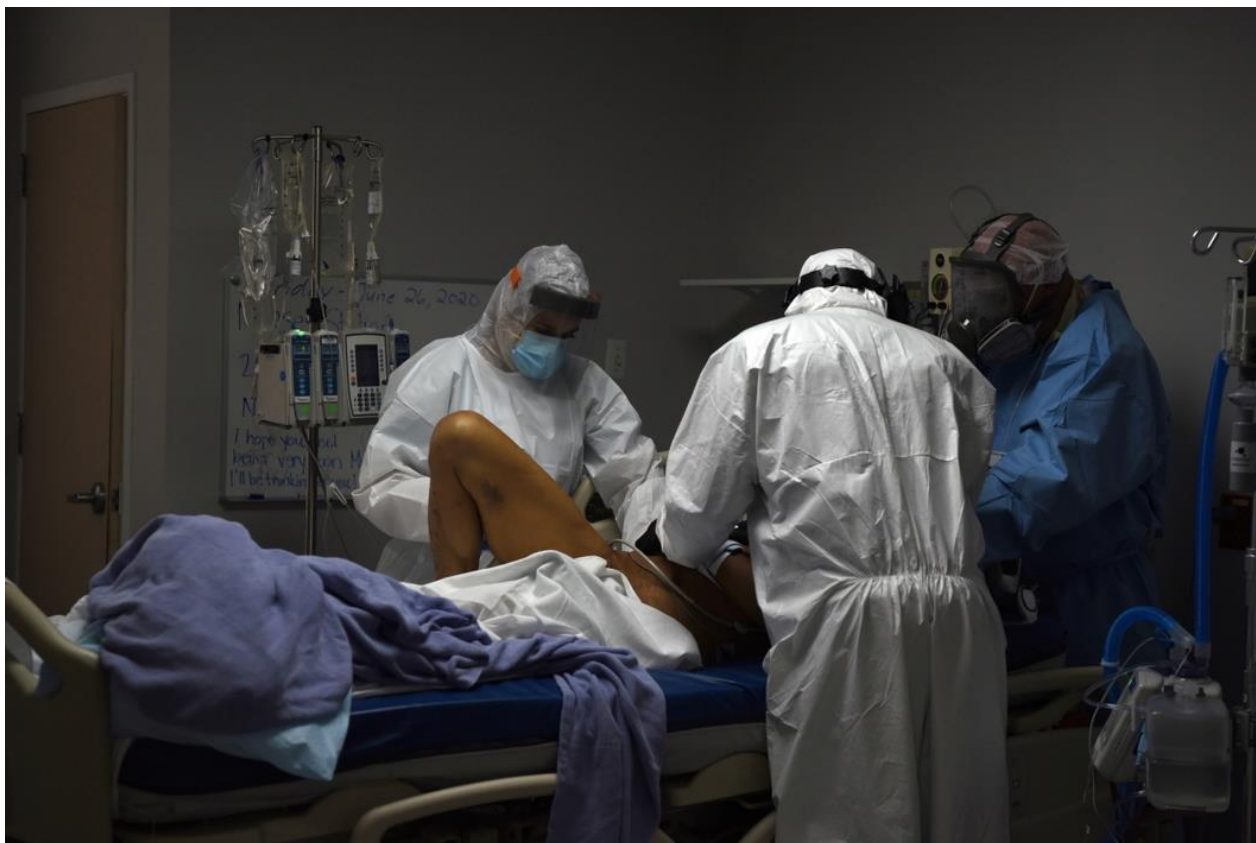
Госпиталь в Хьюстоне.

Наиболее драматически продолжает развиваться ситуация в США (1-е место в мире по числу заболевших). В целом многие штаты уже возвращаются к прежней жизни, многие экономические сферы восстановились, перепрофилированные госпитали переходят на оказание плановой